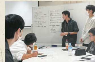
まちLabo開催時の様子

3月8日(土)にHome&nicoホール(江南市民文化会館)で開催された「江南市SDGsシンポジウム」での報告会では、来場者の意識向上を目的に、リアルタイムでのアンケートなど参加型のプレゼンテーションを実施しました。