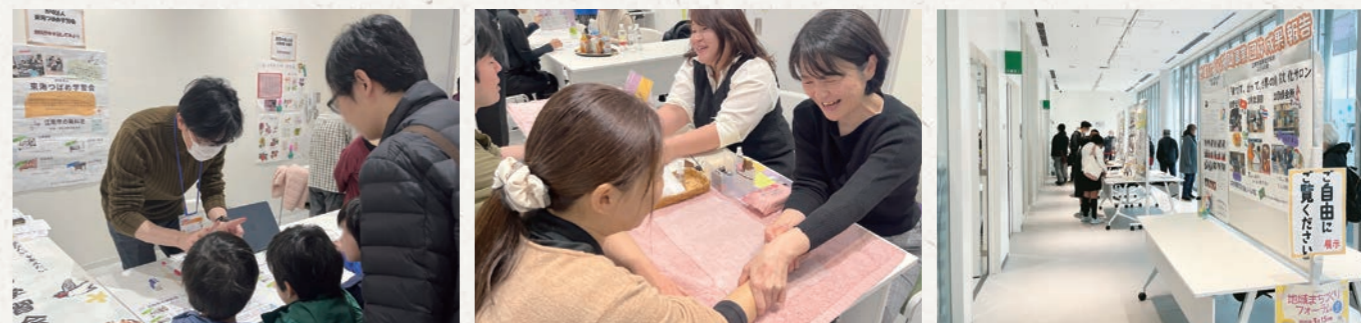
地域まちづくりフォーラム