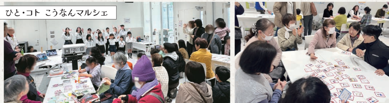
ひと・コト こうなんマルシェ