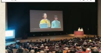
江南SDGsシンポジウムでの発表